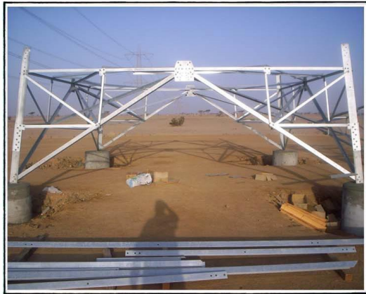
2nd Stage for Overhead Transmission Line